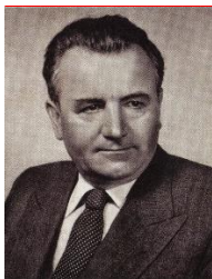
Klement Gottwald 1948 – 1953