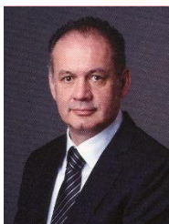
Andrej Kiska 2014 – 2018