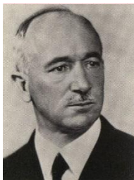
Edvard Beneš 1935 – 1948