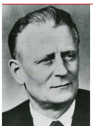
Antonín Novotný 1957 – 1968