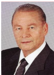
Rudolf Schuster 1999 – 2004