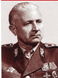
Ludvík Svoboda 1968 – 1975