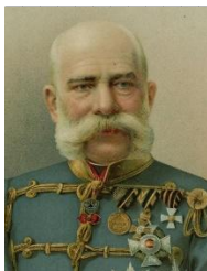
František Jozef 1848 – 1916