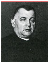
Jozef Tiso 1939 - 1945