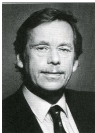
Václav Havel 1989 – 1992