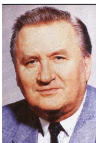
Michal Kováč 1993 – 1998