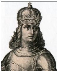
Matej Korvín 1458 – 1490