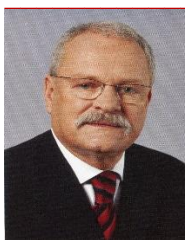
Ivan Gašparovič 2004 – 2014