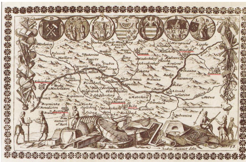
Plán siedmich členských bankských miest. Celkom vpravo podčiarknutá Ľubietová, Banská Bystrica, Kremnica, Banská Štiavnica, Banská Belá,