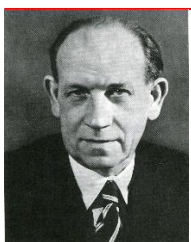
Antonín Zápotocký 1953 – 1957