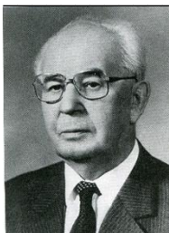
Gustáv Husák 1975 – 1989