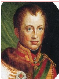
František V. 1835 - 1848