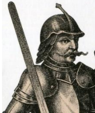
Ján Huňady 1446 – 1453